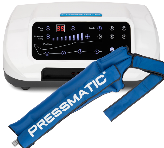
PRESSMATIC PM-4000D Z MANKIEM NA RĘKĘ L