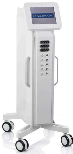
PRESSMATIC PM-20000DBT (DIGITAL/BLANKET/TOWER)